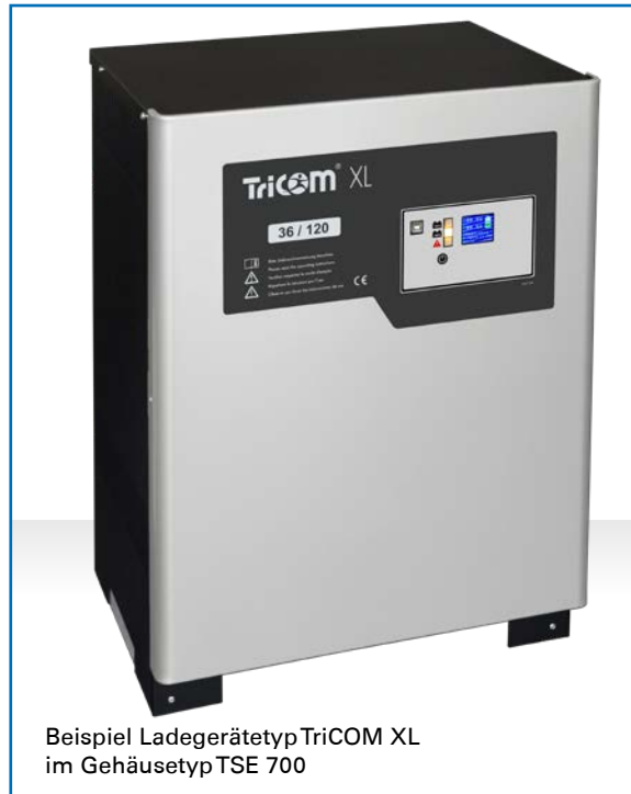
Beispiel Ladegerätetyp Tricom XL im Gehäusetyp TSE 700